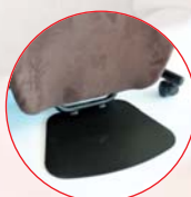
Palette pour les pieds (sauf type D).