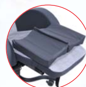
Coussin standard de positionnement hanches/genoux pour prolonger les positions allongées (lit et coquille au moins 15h par jour). Sur prescription médicale.