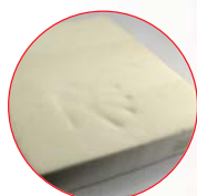
Assise mousse visco-élastique pour une prévention accrue des escarres. Sur prescription médicale spécifique.