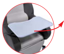
Tablette ventrale escamotable (pour type C).